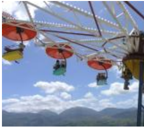
RB Ride di Carsten Höller nel parco del Pollino